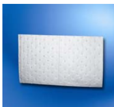
Paños absorbentes para derrames de gasóleo