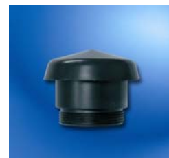
Seta de aireación