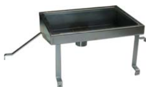
Embudo para Unitech