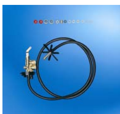
Kit de aspiración