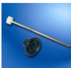
Silbato limitador de llenado