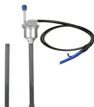
Bomba manual Unitech