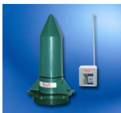
Rothalert (medidor a distancia para mayor comodidad)