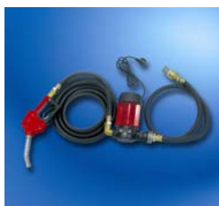
Equipo de trasvase