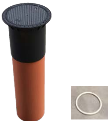
Imagen 1: Torre y junta telescópica

Los Depósitos de Acumulación disponen, en su parte superior, de una torre de realce circular ajustable en altura, para realizar el mantenimiento y vaciado de Ø 200mm. Esta torre viene con junta y boca.