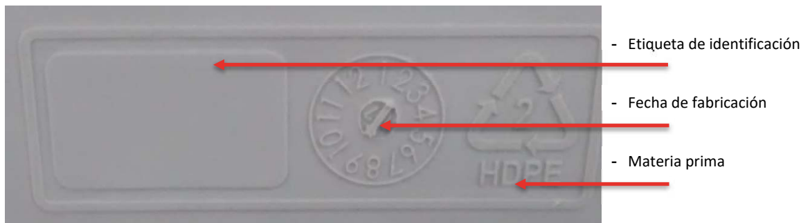
Figura 1 Placa de identificación depósitos Rothagua cerrado EcoCompact.

Se colocarán los depósitos de tal forma que la placa de identificación (código identificación, fecha de fabricación, tipo materia prima) quede a la vista.