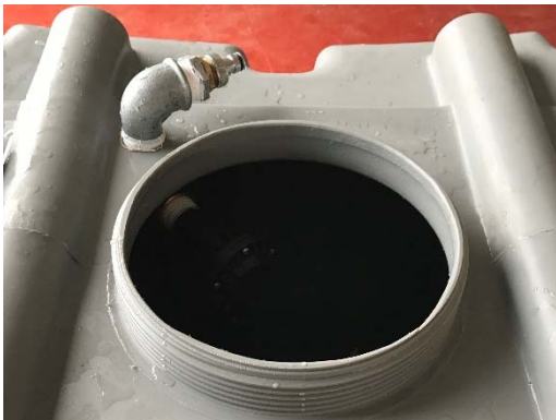
Figura 2 Regulador de nivel con acople.

Sistema de regulador de nivel Mecánico (Fig. 2 y 3). Una vez taladrado el inserto metálico mediante junta de corona DN30 y realizar hilos de rosca 1" GAS, instalar regulador de nivel RSA 1" mediante codo 90º roscado.