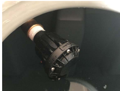
Figura 3 Regulador de nivel con acople.

En todos los casos en los que se utilice un sistema de regulador de nivel es OBLIGATORIO instalar: