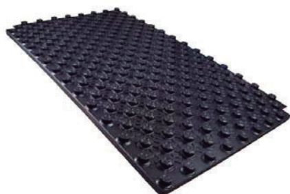
Placa de nopas 26 Térmica Stark