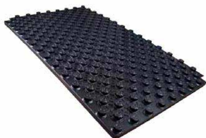
Placa de nopas 17 Térmica Stark