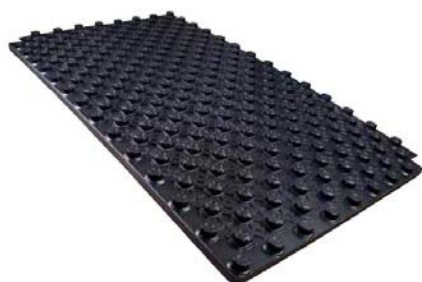
Placa de nopas 17 Térmica Stark