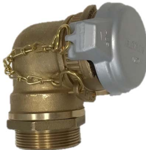
Imagen del conjunto montado

Todos los datos, informaciones técnicas y dimensiones indicados en este documento son a título informativo y pueden ser modificados sin previo aviso.