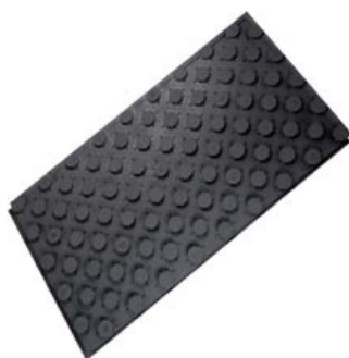
Placa de nopas 23 Térmica